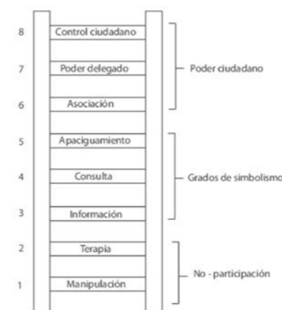
Escalera de participación de Sherry Arnstein, 1969

Murueta no es solo un lugar físico: es un espacio simbólico cargado de significados colectivos. Según Ben Anderson (2009), los espacios generan atmósferas afectivas: formas de afecto compartidas que exceden al individuo pero se sienten íntimamente, configurando percepciones y acciones. Las 945 hectáreas del humedal combinan orgullo territorial, memoria histórica, sensación de agravio por el abandono institucional y narrativas de protección del humedal. No es solo un entorno natural, ahora es también un símbolo identitario y político. La intervención en un espacio así requiere comprender su triple dimensión: material (humedal y terrenos contaminados), discursiva (narrativas de reserva protegida o de imposición) y afectivo-simbólica (atmósferas de desconfianza o resistencia). Estas dimensiones crean un ambiente colectivo que impide un debate constructivo si no se reconoce su complejidad.